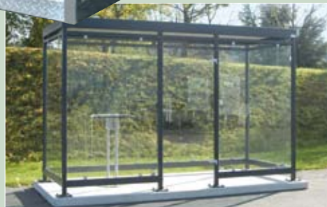
Raucherraum, Modell K Fußboden-Betonplatte inklusive! 3.900 x 1.510 x 2.510 mm Stahl-Glaskonstruktion mit Ganzglasure. Zubehör: Raucherstehisch