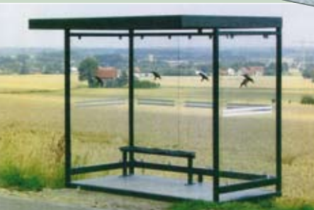
Wartehalle, Modell K 3 Fußboden inklusive! 3.180 x 2.165 x 2.510 mm Stahl-Glaskonstruktion. Zubehör: Fußboden, Sitzbank, Piktogramme