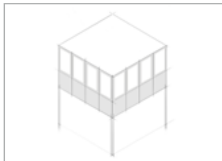
Standard auf Bühne